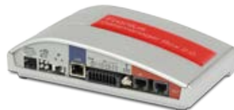
/ Fronius Datamanager Box 2.0