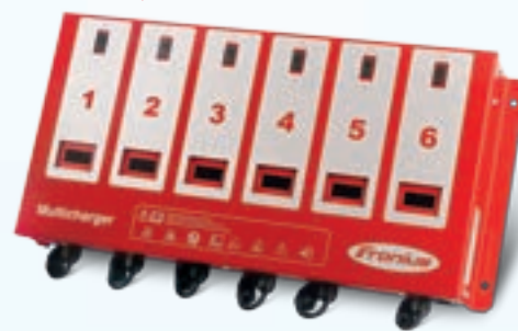
ALMACÉN ACCTIVA MULTICHARGER