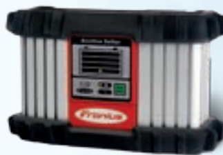
SALA DE EXPOSICIÓN ACCTIVA SELLER 30A