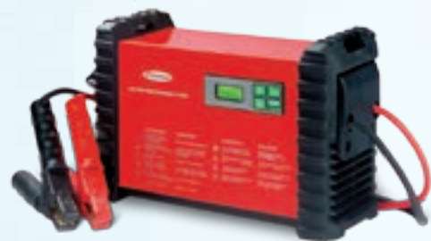
ENTREGA DE VEHÍCULOS ACCTIVA PROFESSIONAL FLASH 70A