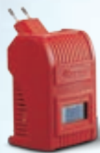
ACCESORIOS ACCTIVA EASY